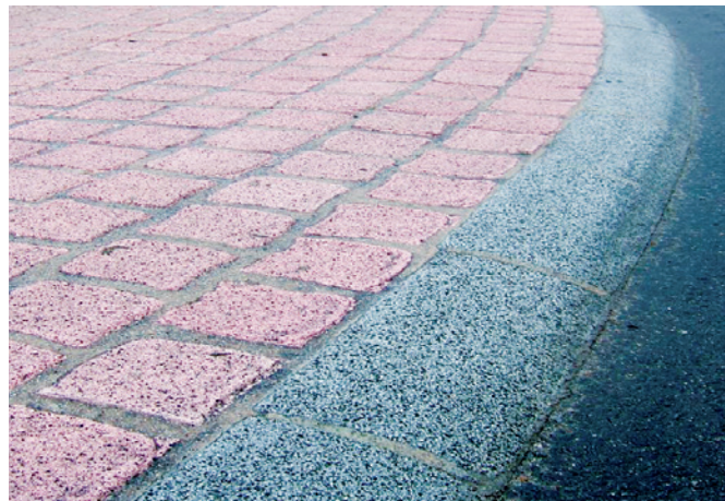
Séparation de l'espace de trafic