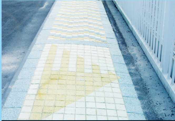
Revêtement de zone piétonnière