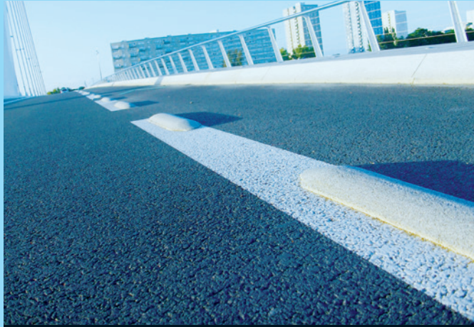
Guidage du trafic