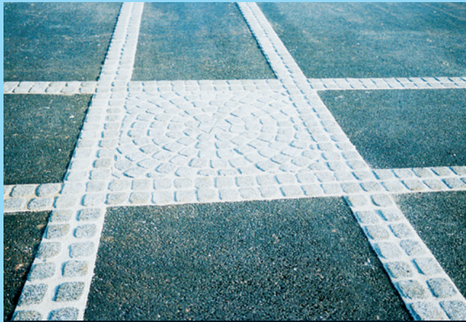
Installations de parking