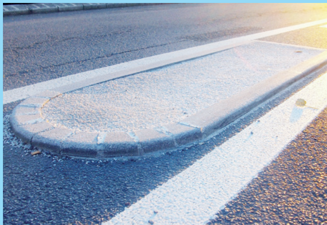
Ilot de trafic