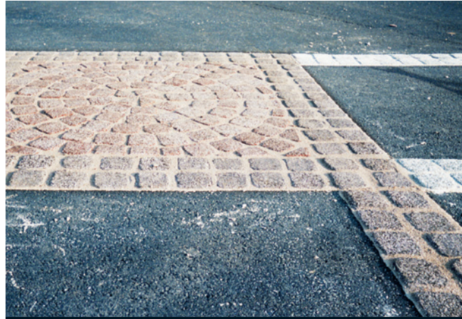
Aménagement de zones de stationnement