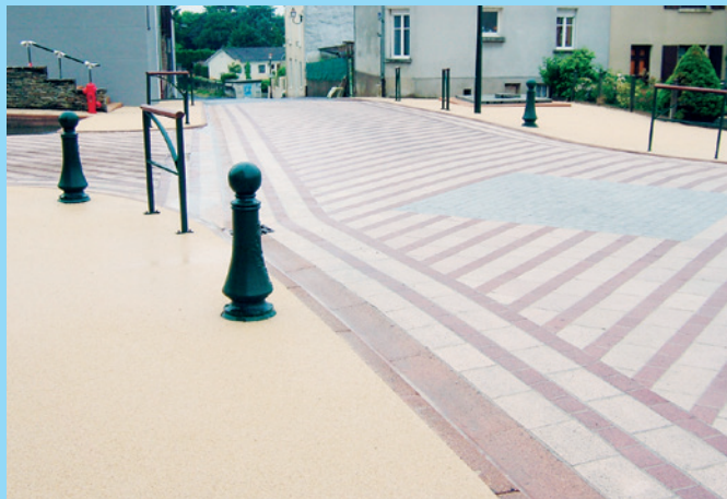
Zone à modération du trafic/zones de rencontre