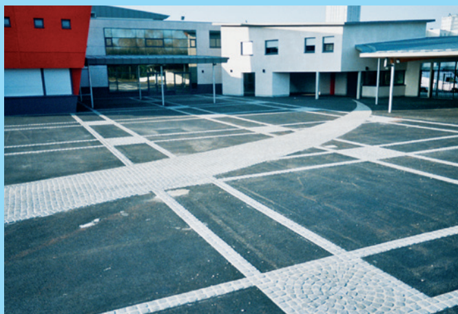
Aires à proximité d'édifices publics