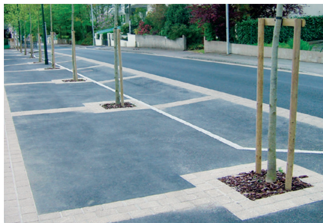
Aménagement d'aire et de zone de stationnement