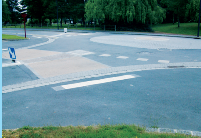
Verkehrsteiler hier am Beispiel «Kreisverkehr»