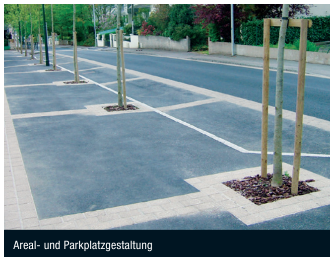
Areal- und Parkplatzgestaltung